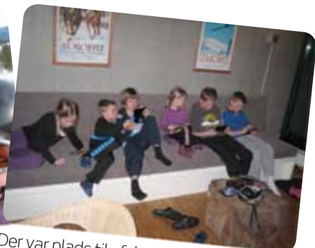
Der var plads til afslapning og hygge både inde og ude. Familierne havde hver deres lejlighed, men kun få meter fra hinanden, så børnene frit kunne løbe frem og tilbage. Familierne skiftede til at servere den medbragte aftensmad for hinanden