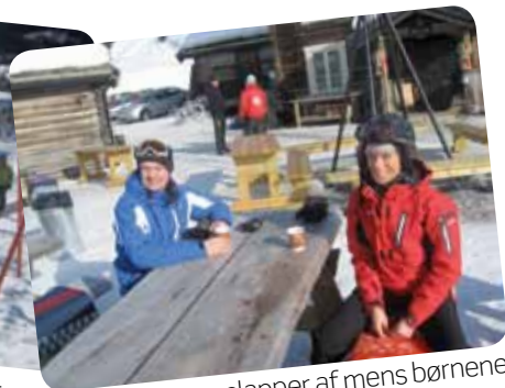
De voksne slapper af mens børnene er på skiskole