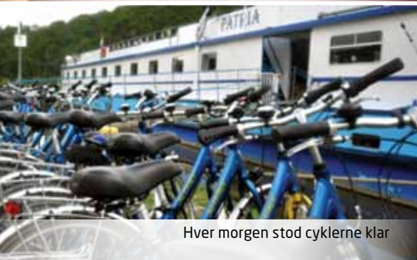
Hver morgen stod cyklerne klar