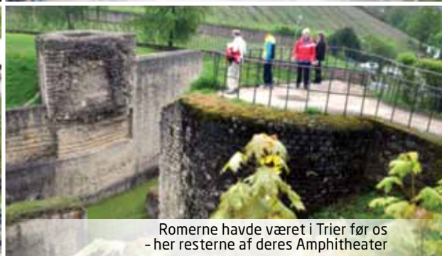
Romerne havde været i Trier før os - her resterne af deres Amphitheater