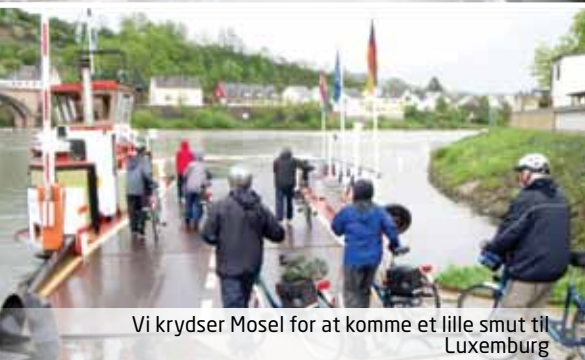
Vi krydser Mosel for at komme et lille smut til Luxembourg