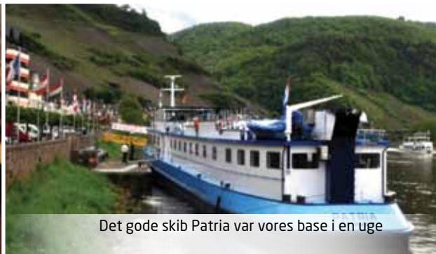
Det gode skib Patria var vores base i en uge